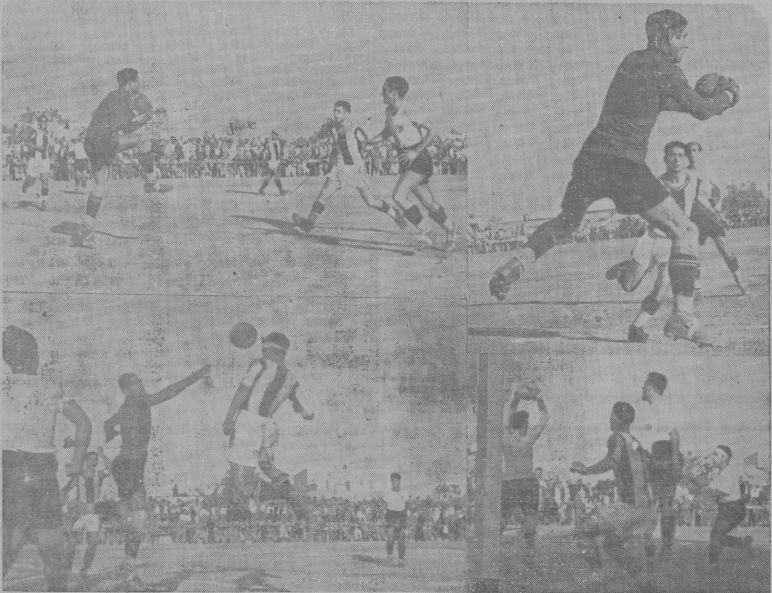
FUTBOL.—Cuatro aspectos del partido inaugural del Campeonato Regional de Baleares, en que venció el Baleares al Constanca por 3 a 1 Foto Arbós