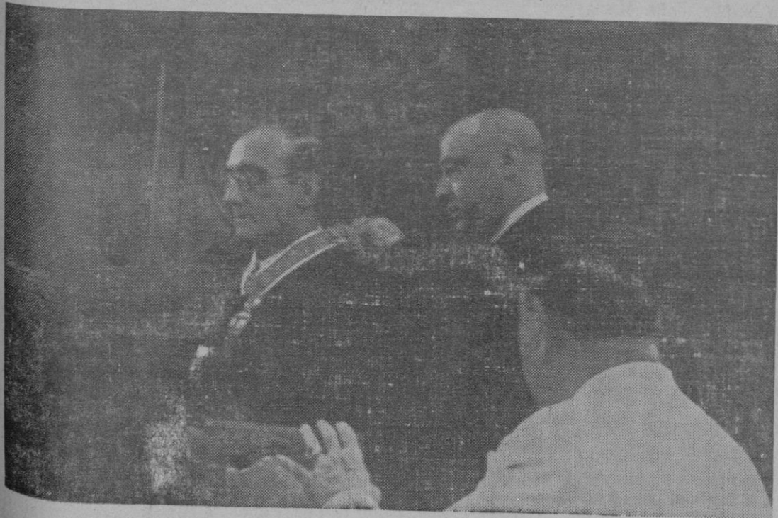
IMPOSICION DE INSIGNIAS

Hemos atravesado la interminable poterna y nos ha resultado eminentemente antipática. Al volver a la luz al plé de la Porta Nova nos bañamos en los mismos lugares donde se bañaron hacia cien años las bellas ibicencas que no tenían las tinieblas... Pero, ya no estaban allí. Hoy la mujer ebusitana no cruza ya la vieja mina para ir en busca del