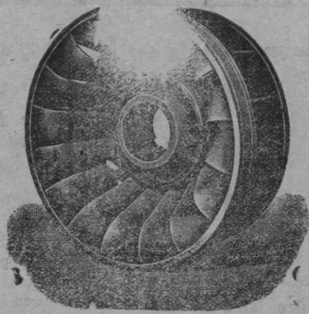
Rodete Turbina "Francis,"

Abonad con Nitrato de Sosa de Chile. Es un abono excelente para toda clase de cultivos. Se vende en todas las casas importantes que se dedican al comercio de abonos. Informes y folletos gratis para su aplicación, dirigiéndose al COMITÉ DEL NITRATO DE SOSA DE CHILE, Almirante, 19, Madrid. Apartado número 6.