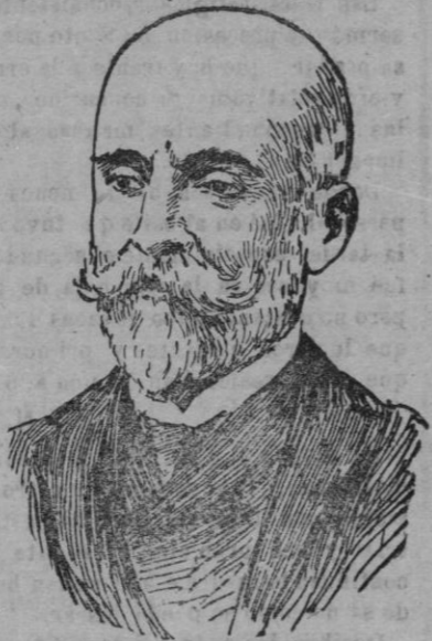
Excmo. señor don Bernardino Machado, presidente del Consejo de ministros portugués, que con gran acierto ha logrado normalizar la política en dicho país