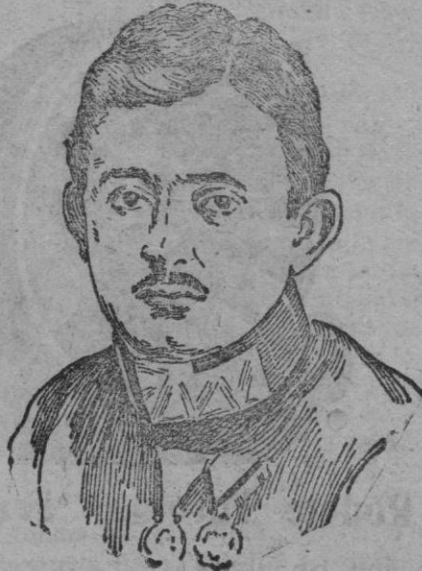
Carlos Francisco José, ex emperador que, según dicen de París, propone trasladar su residencia a España, a vista de su fracasado intento de restablecer la monarquía en Hungría.