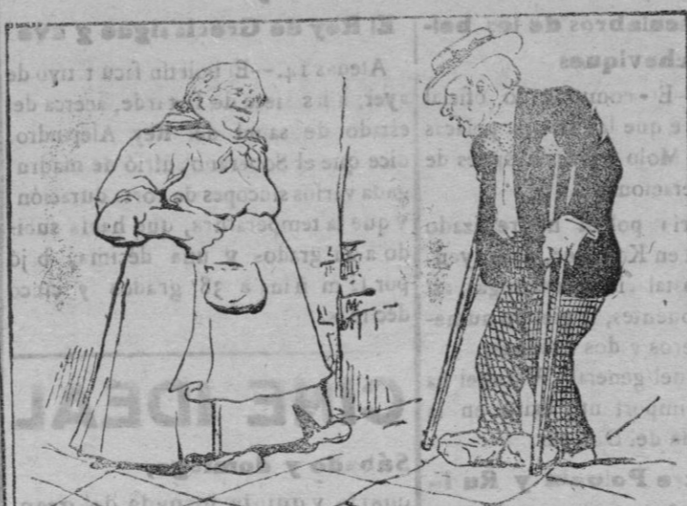
SOLUCIONES Y CONFLICTOS

—Pero don Homobono, ¿qué le ocurre? —¿Qué quiere usted; como está tan caro el calzado me compré unas botas marca Nacional y he tenido que puntalar el edificio!