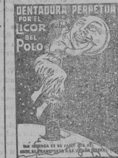
LA BIENESER EN SU PAIS POR EL LICOR DEL POLO