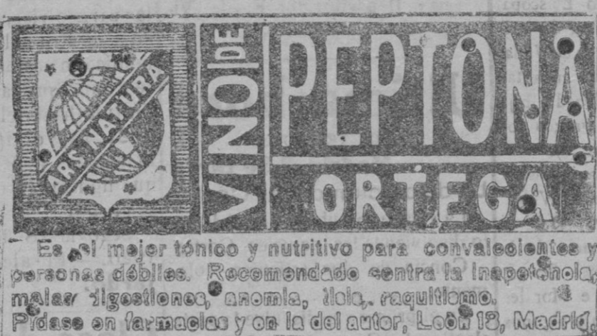
Es el mejor tónico y nutritivo para convalecientes y personas débiles. Recomendado contra la inapetencia, males digestivos, anemia, etc.

Se vende cemento bueno. Aranda de Duero, Plaza Trigo, en casa del Segúlv