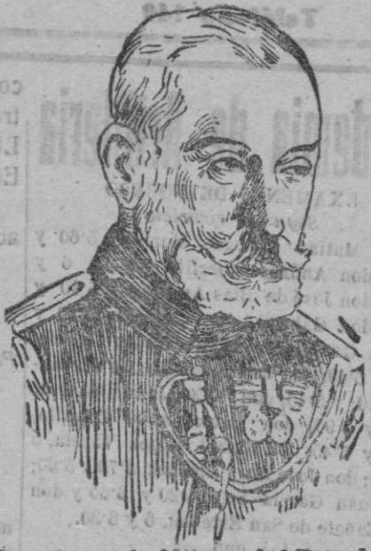
Don Joaquín Milans del Bosch, teniente general nombrado jefe de la Casa militar del Rey