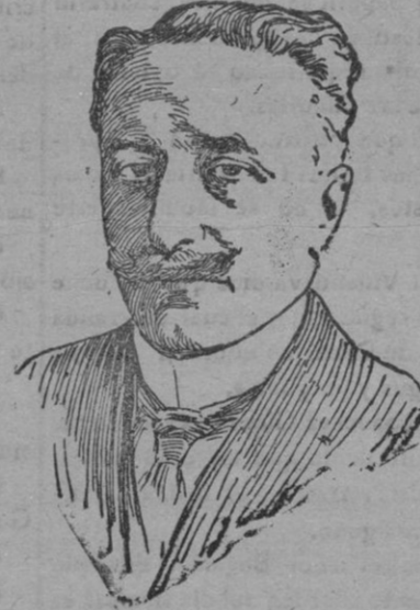
M. Paul Dechanel, que ha sido nombrado Presidente de la República francesa