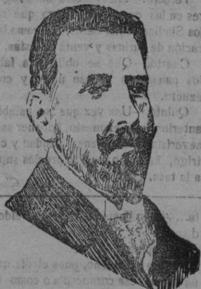
DON JOSÉ RELVAS,

presidente del consejo de Ministros de la República portuguesa, que ha presentado la dimisión