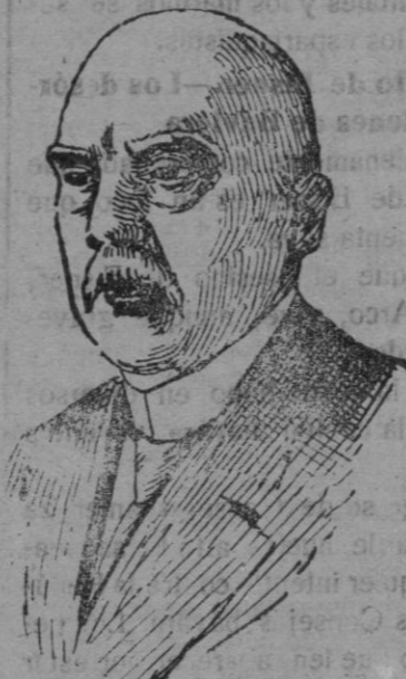
Mr. William Sharp,

embajador de los Estados Unidos en París, que ha sido sustituido por el coronel House, por haber presentado la dimisión.