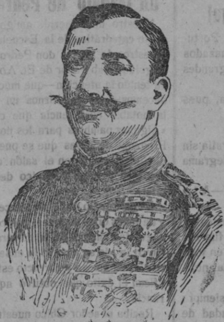
El ex ministro de la Guerra general don Dámaso Berenguer, que ha sido nombrado alto comisario general de España en Marruecos.