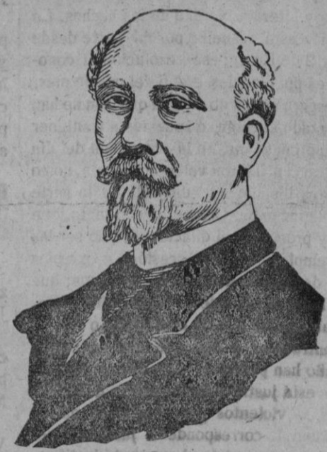
Herr. Felipe Scheidemann,

ministro de Negocios Extranjeros del Gobierno provisional alemán, y uno de los políticos más diestros de su país.