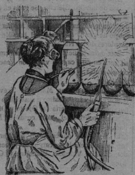
Fabricación de municiones de grueso calibre, por mujeres francesas.