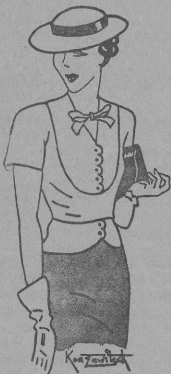
Blusa combinada y original de forma, para paseo y también para sport, de tonos claros. Debe usarse sobre una falda oscura. No lleva adornos.