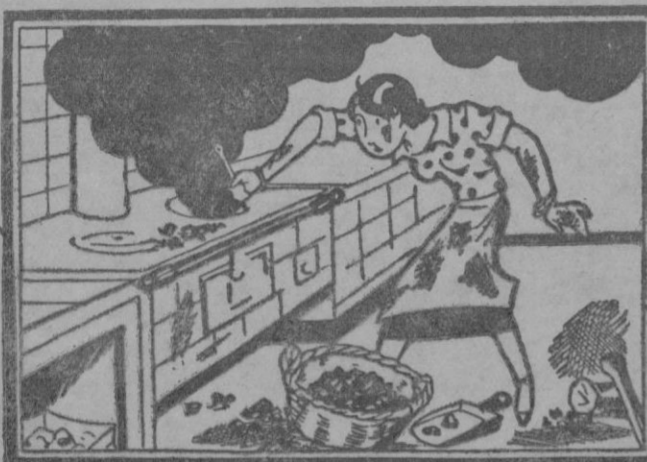
ELLA: Si no fuera por esta cocina la vida sería más agradable.