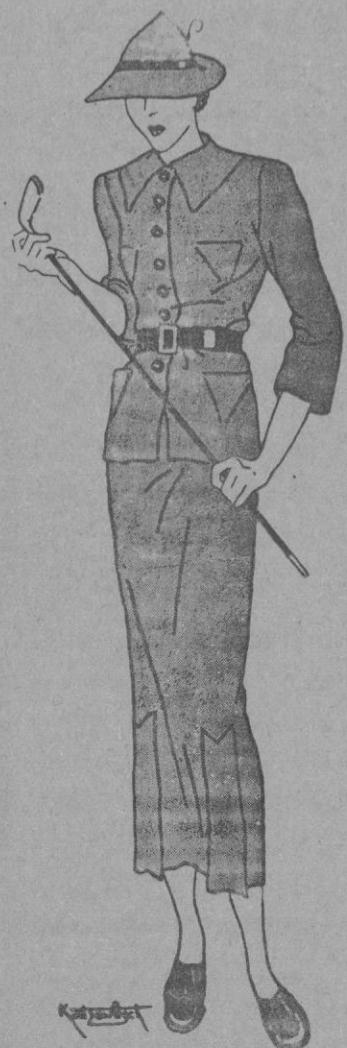
Elegante vestido de sport con chaqueta de tipo «cosaco», muy apropiado para partidas de «golf».

tas nada menos que durante varios años... y con el mismo epígrafe.