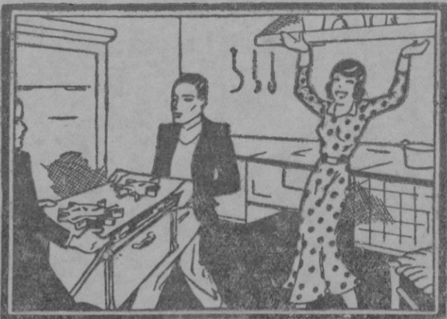
ELLA: ¡Al fin! Se acabó la suciedad. ¡Ahora cocinar será un encanto!