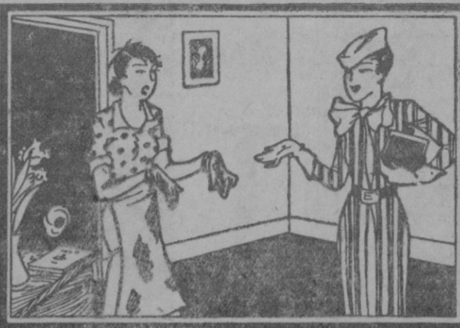
ELLA: Fijete lo sucia que me encuentro; llevo rato batallando con la cocina. AMIGA: Por eso yo aproveché la CAMPAÑA ANUAL DE GAS Y ELECTRICIDAD y tengo tiempo para todo.