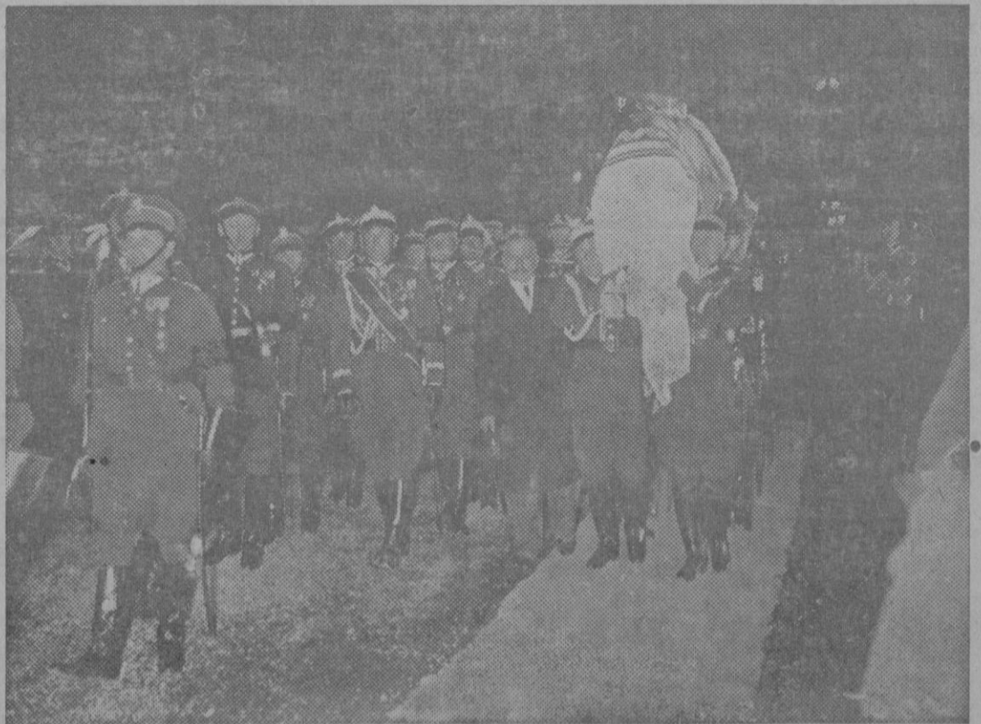
ENTIERRO DEL MARISCAL PILSUDSKY.—Los restos del Mariscal Pilsudsky, han sido inhumados en la cripta real del palacio del Wawel de Gerasovia. El féretro conteniendo los restos del mariscal llevado a hombros por los generales del ejército polonés.