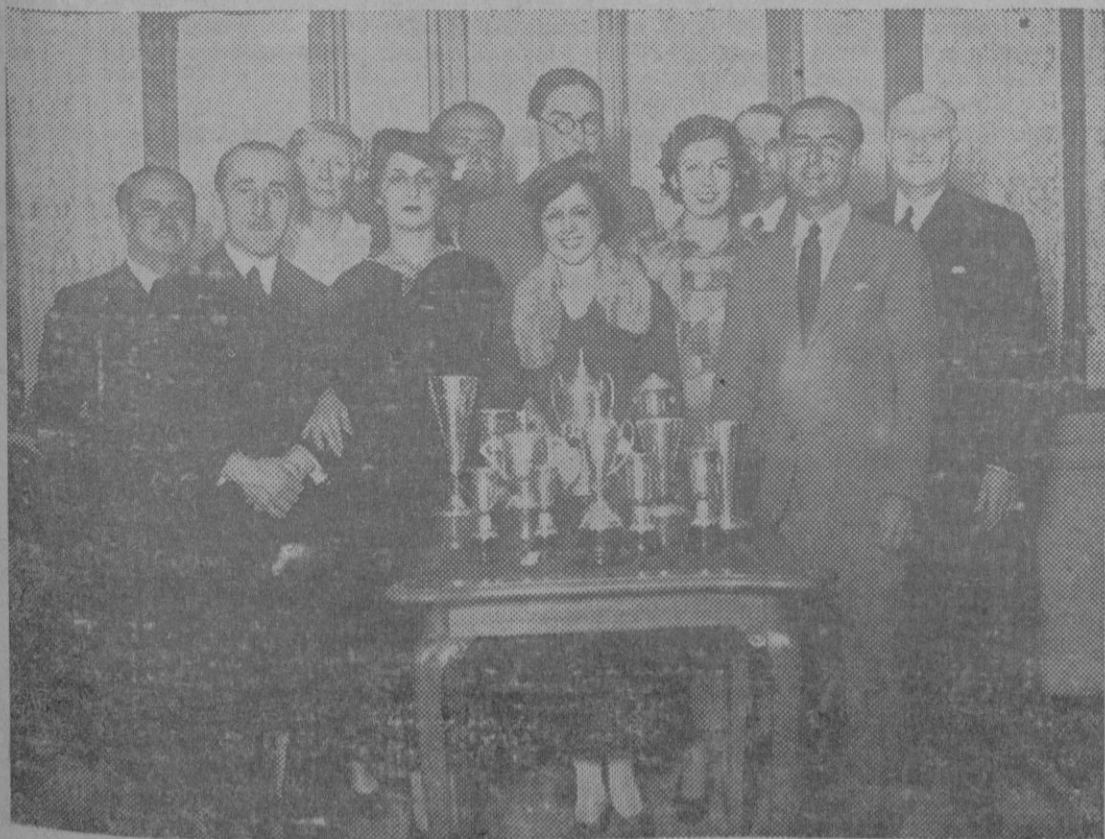
«LAWN TENNIS CLUB MALLORCA».—Grupo de campeones de Baleares del noble deporte y directivos del «Club».