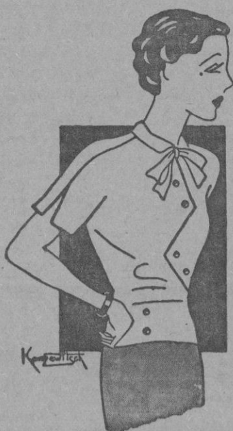
Original blusa de líneas modernas a confeccionar, indistintamente, en seda, lanilla, u otra tela ligera. Los colores más apropiados son el blanco, el crema y el gris perla.

Prepárese en coctelera: Unos pedacitos de hielo. Una cucharada de las de café de jugo de naranja. Una cucharadita de curacao rojo. Una cucharadita de granadina. Media copita de Courvisier. Agítense bien y sírvase en copa de cock-tail.