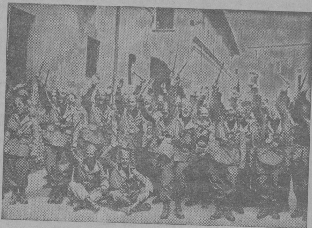
LA MOVILIZACION ITALIANA.—Las nuevas divisiones movilizadas se completan rápidamente y sus efectivos se dirigen dentro las casernas. Un grupo de movilizadas saluda alegremente al fotógrafo levantando el sablebayoneta.

En el Consejo de ministros celebrado ayer, se acordó el ascenso de 117 tenientes, que estaban postergados con lo cual se logra una economía para el Tesoro.