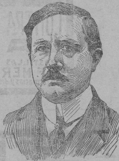
Don José Martínez Ruiz «Azorín», nuevo subsecretario de Instrucción Pública