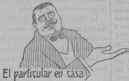
El particular en casa