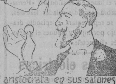
Y el aristócrata en sus salones

prefieren sobre todas las demás la lámpara EGMAR