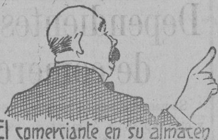
El comerciante en su almacén