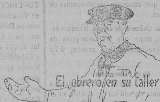
El obrero en su taller