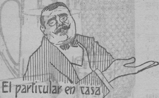
El particular en casa