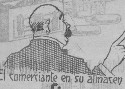
El comerciante en su almacén