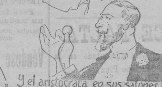
Y el aristócrata en sus salones