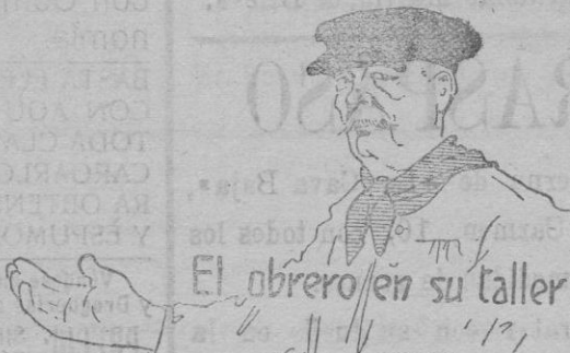
El obrero en su taller