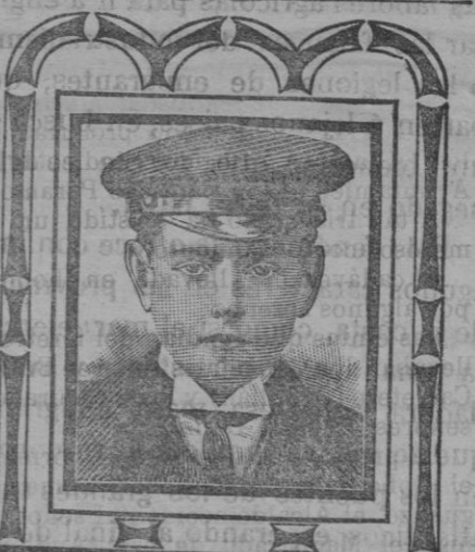
Barcelona, 11 Abril 1908. CALLE CONDE ASALTO NO. 42.

Mañana, si se reúne número suficiente de señores ediles celebrará sesión el Ayuntamiento en primera convocatoria y en el caso de que no se pudiese celebrar por falta de número reglamentario, esta tendrá lugar á la hora de costumbre el sábado 26.