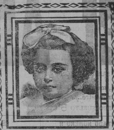
Barcelona, 11 Febrero 1908.