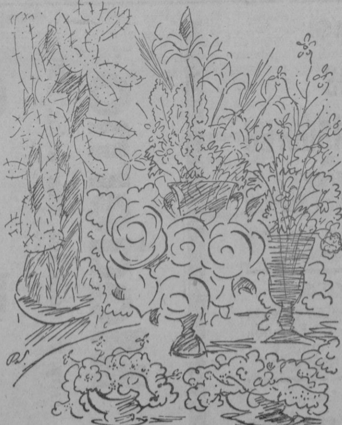
Recuerdo de la exposición de flores por P. S.