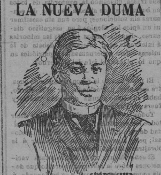
Gulubef, uno de los «leaders» de la tercera Duma.

LA NUEVA DUMA Algunas señoras se arrojaron por los balcones á la calle. Han perecido abrasadas treinta mujeres. Hay otras muchas heridas de gravedad. El edificio ha quedado destruido.