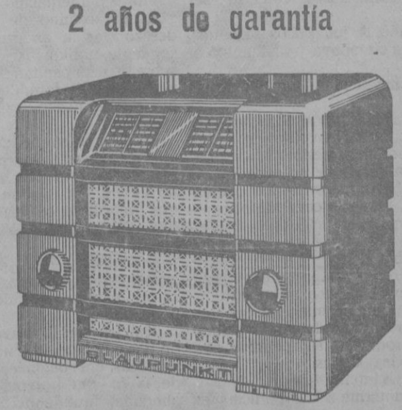
Caja armónica Altavoz Superhumano