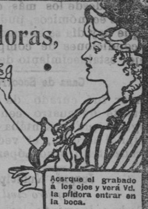
Acroque el grabado á los ojos y verá Vd. la píldora entrar en la boca.