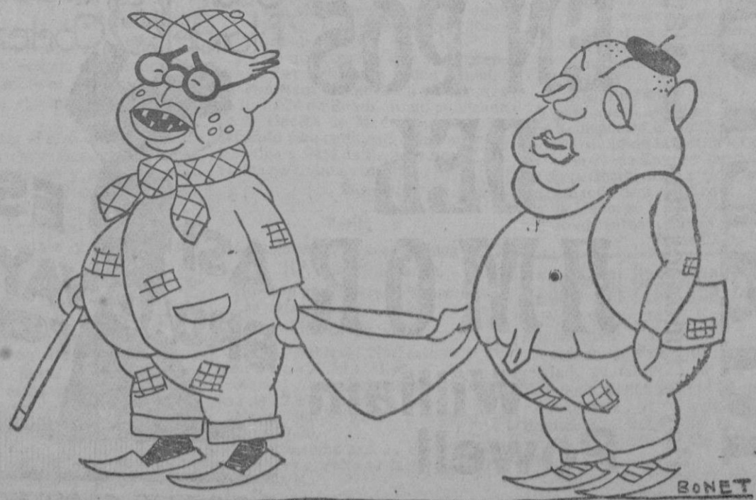
Dos «sin trabajo»