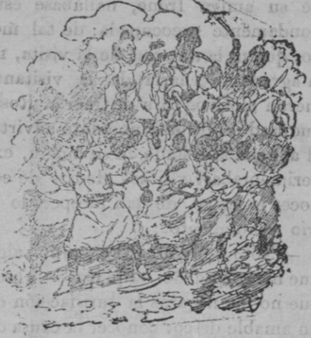
sobre la hermosa mezcquita del soberbio califato.

El año mil cuatrocientos noventa y dos es llegado Por Guadalete. con sangre, en ocho siglos rodando, pasaban las turbias ondas. Siempre jenganzal clamando, y jenganzal repetían corazones esforzados. El pendón aborrecido del Profeta, acorralado, cedia el paso á la Cruz que ya se va tremolando