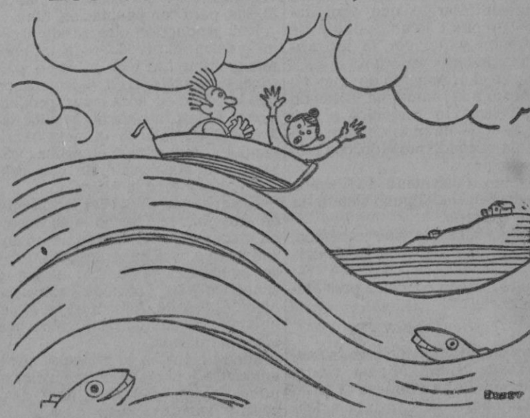
—¡Ay, Marial Tenemos que volver a casa, porque he olvidado los remos.