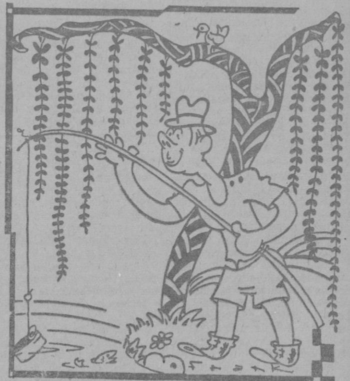
Caramba, ahora me entero yo que las latas se crían en el agua.