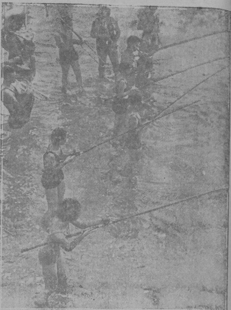
En las cercanías de Near Wildwood utilizan unos alegres pescadores de caña el «jazz-band» para atraer con sus graciosas estridencias a los peces remisos en acercarse a los anzuelos