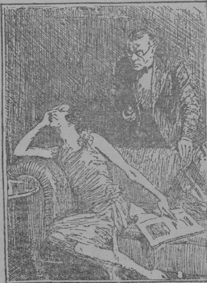
El marido (alarmado).—¿Qué es lo que te pasa, Anita? La esposa.—Que acabo de enterarme por los diarios de que ahora vuelve la moda de la gordura en las mujeres, y yo acabo de hacerme hacer un adelgazamiento permanente!

Llegado a Madrid la mañana del 15, me encuentro con el desbordamiento general del pueblo. Por doquier, cientos de automóviles o camionetas abarrotadas de mole humana, mujeres, hombres, jovencitos y niños con lazos encarnados ellas y los más con sendas banderas rojas y republicanas. ¡No han parado de vociferar todo el día. Escribo estas cuartillas desde la Central de correos con el estampido del ¡Viva! ¡Viva! y lo extraño es que no están roncós. Largos cartelones alusivos y satíricos cuelgan de los radiadores. Grandes partidas de trabajadores en compaña atraviesan el arroyo entonan-