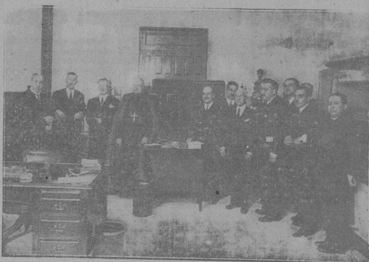
Sevilla: Las autoridades en el acto de inauguración de la Caja de Ahorros Provincial en la casa-palacio de la Diputación