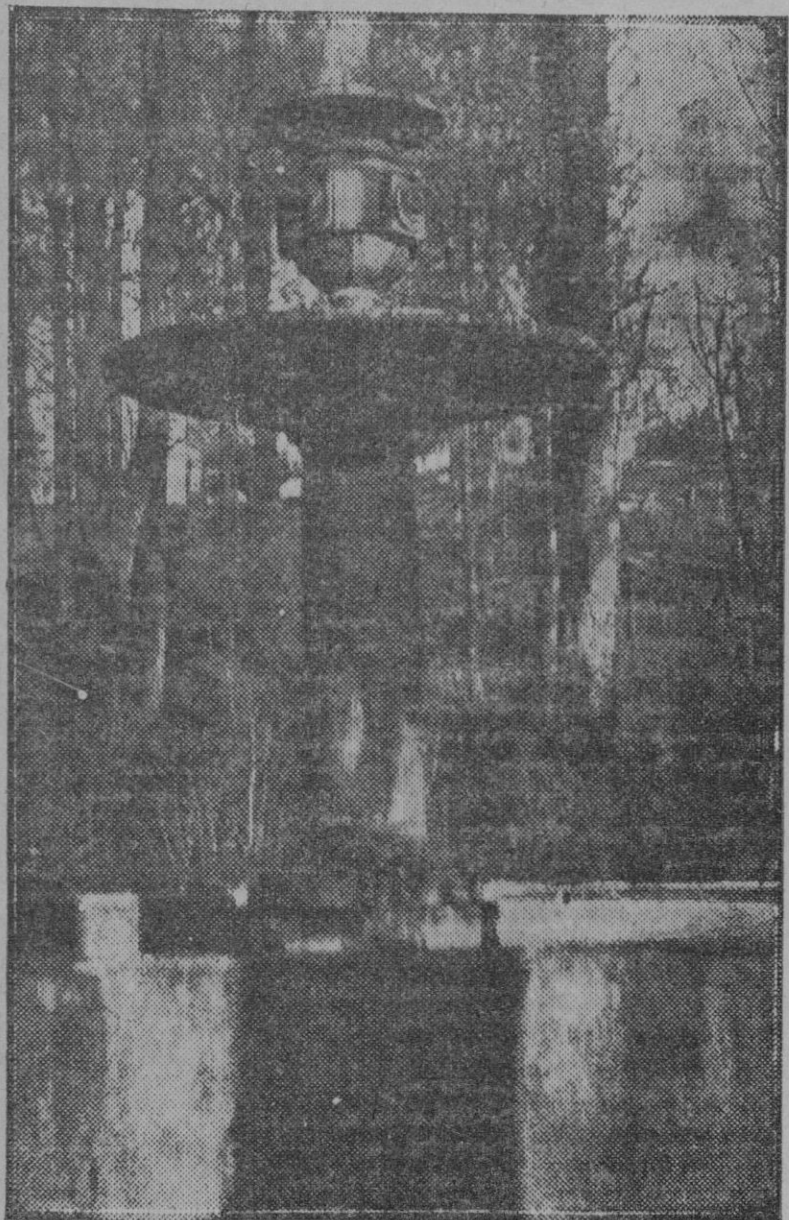
Más artística, aunque menos renombrada, que la fuente de las Damas es la del Laberinto, jardín del que sólo quedan recuerdos y trozos como el reproducido aquí. En el fondo de la fotografía aparecen las alturas de los probables paseos de los aristócratas que iban a descansar a los cenadores próximos a la fuente de las Damas