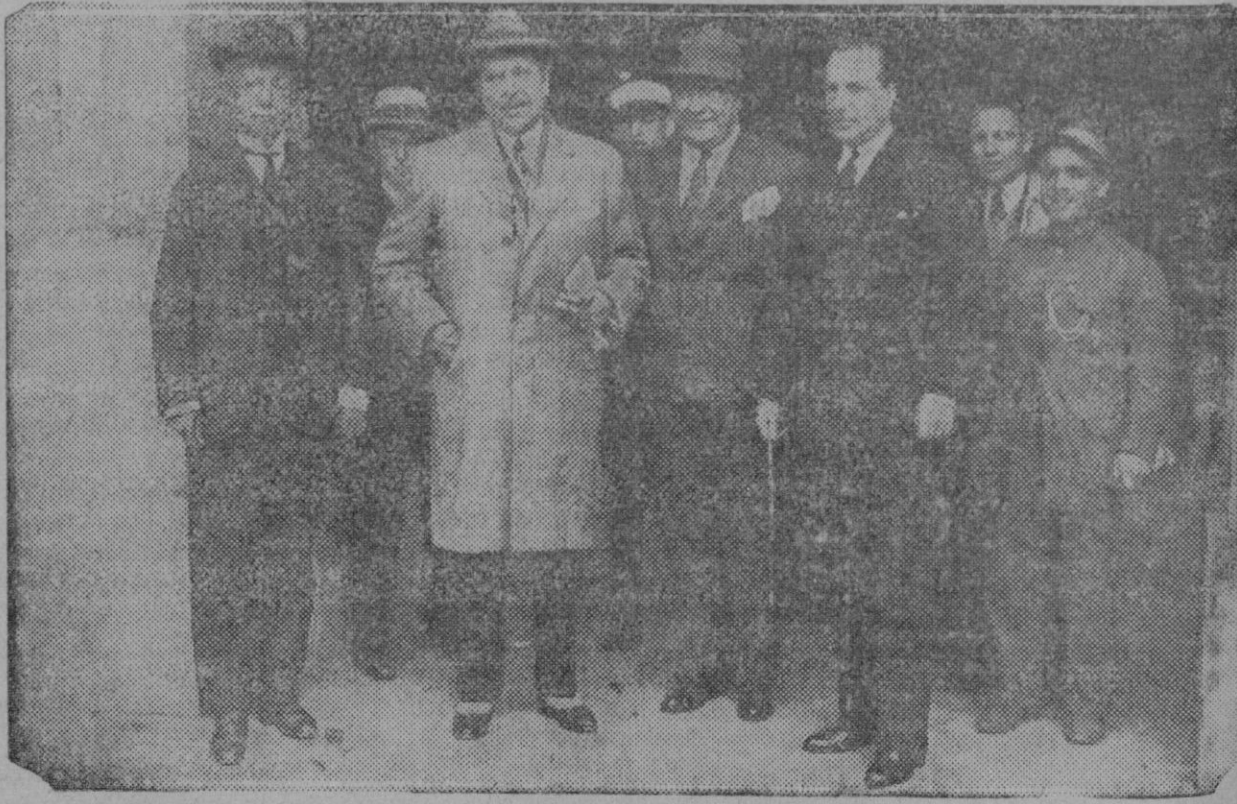
Sevilla: El embajador de Chile, doctor Enrique Bermúdez, a su llegada a esta capital para hacer entrega al Ayuntamiento del pabellón de su país