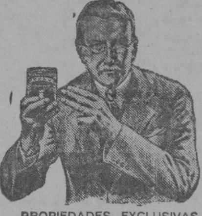
PROPIEDADES EXCLUSIVAS DEL VITOLAN

A NUESTRAS EXPENSAS COMPRE VD. HOY MISMO