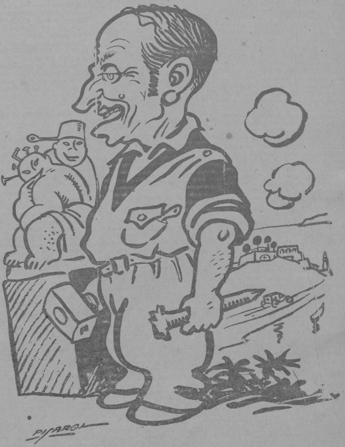
El Escultor José de Creelt