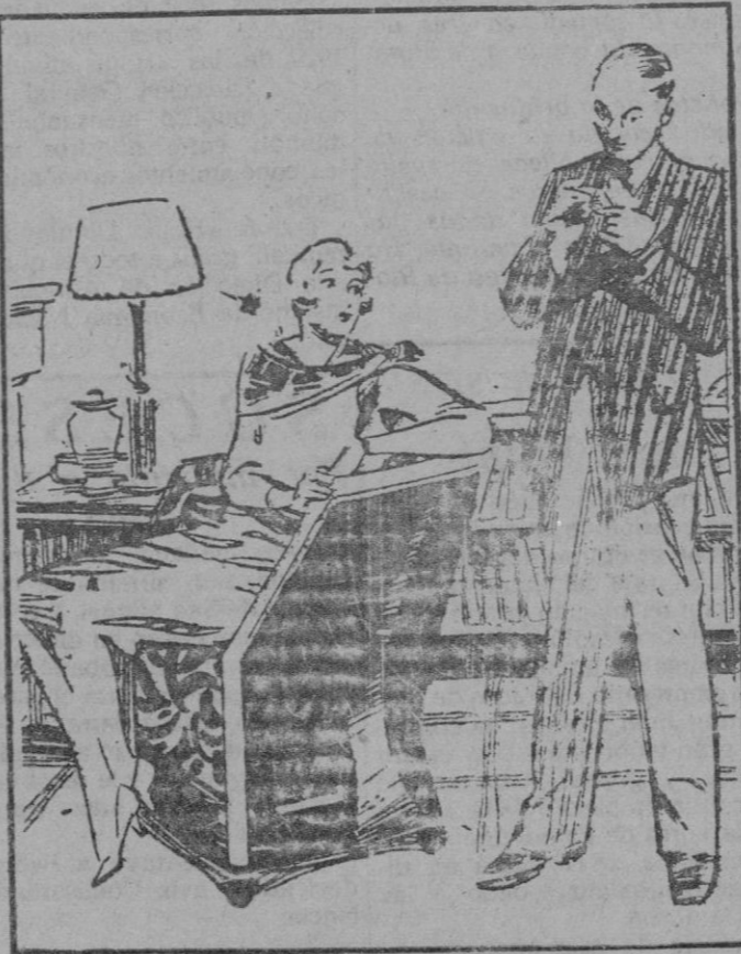
La esposa (al año de casada).—Parece que ya no te acuerdas de lo que aconteció hace hoy un año justo. El marido.—Espera un momento, querida. Consultaré mi diario. ¡Ah, sí; fuimos al baile de máscaras...

Toda la correspondencia literaria y administrativa para EL DIA debe dirigirse al apartado de Correos número 22