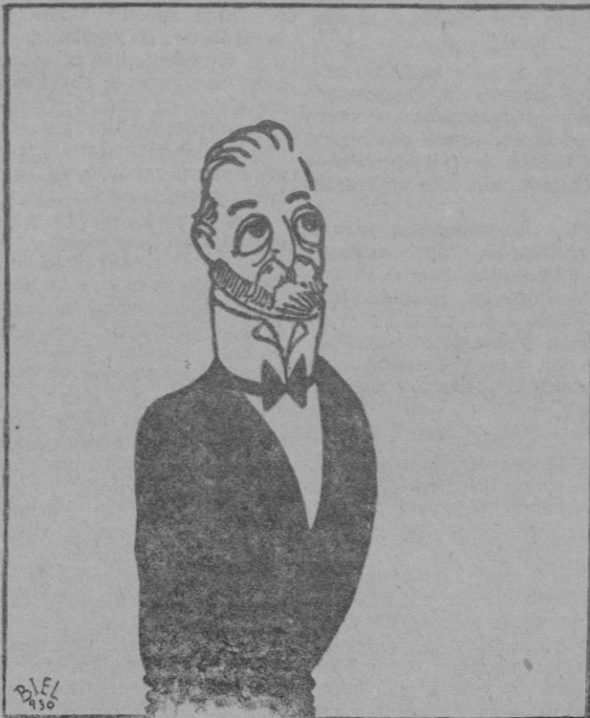
Don José Sánchez Guerra