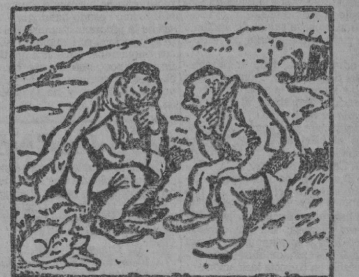
—A los chicos los tengo por esos tejados de Dios, limpiando chimeneas, y lo que saquen «pa» lotería, ¡a ver si cae el gordal! —Es más fácil que te caiga un chico.