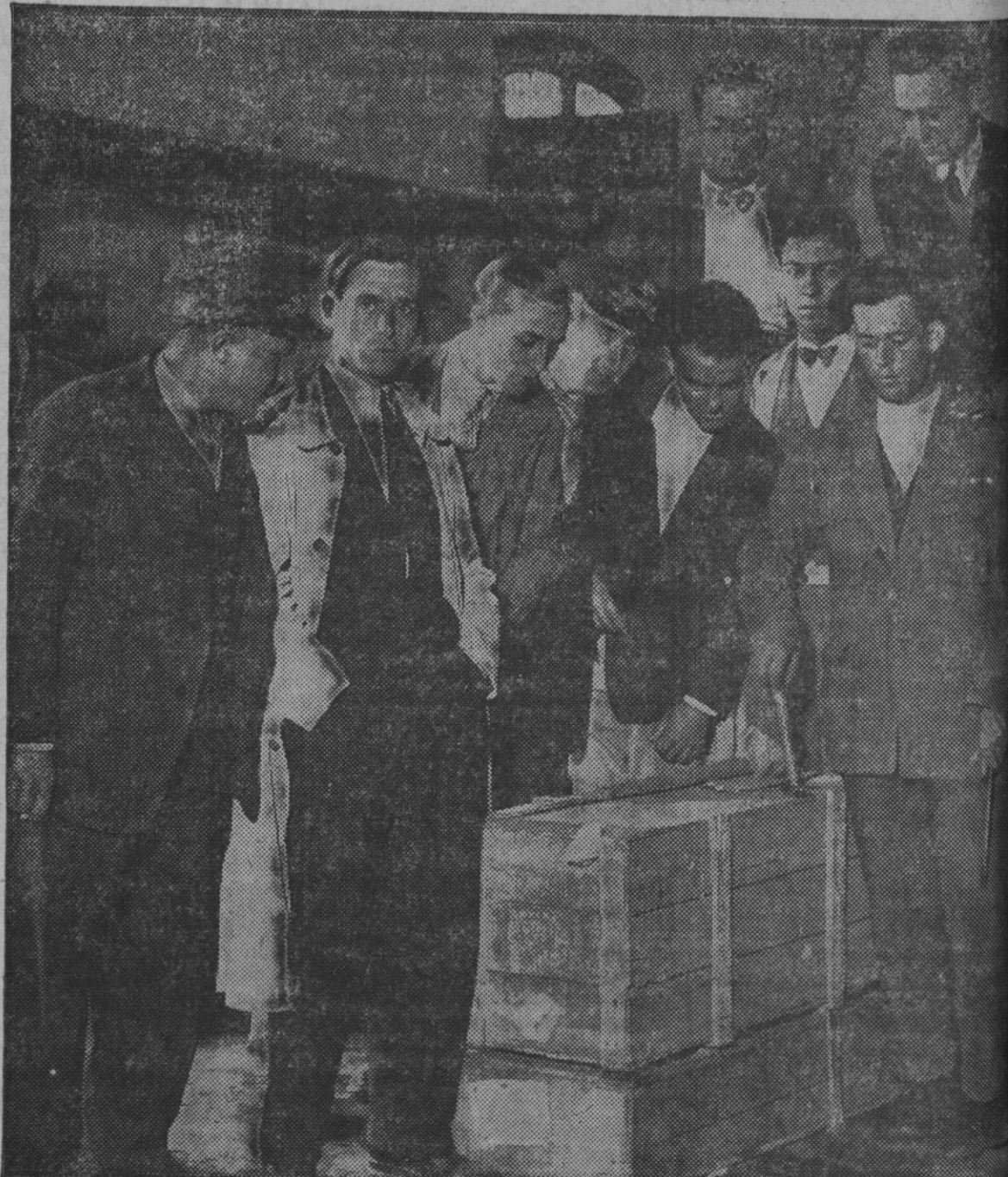
Empleados del muelle de gran velocidad de la estación de Atacha, en el momento de ser descubierta la mercancía