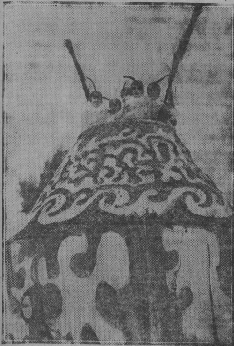
Cartagena: «Tintero de Talavera», carroza ocupada por bellas señoritas