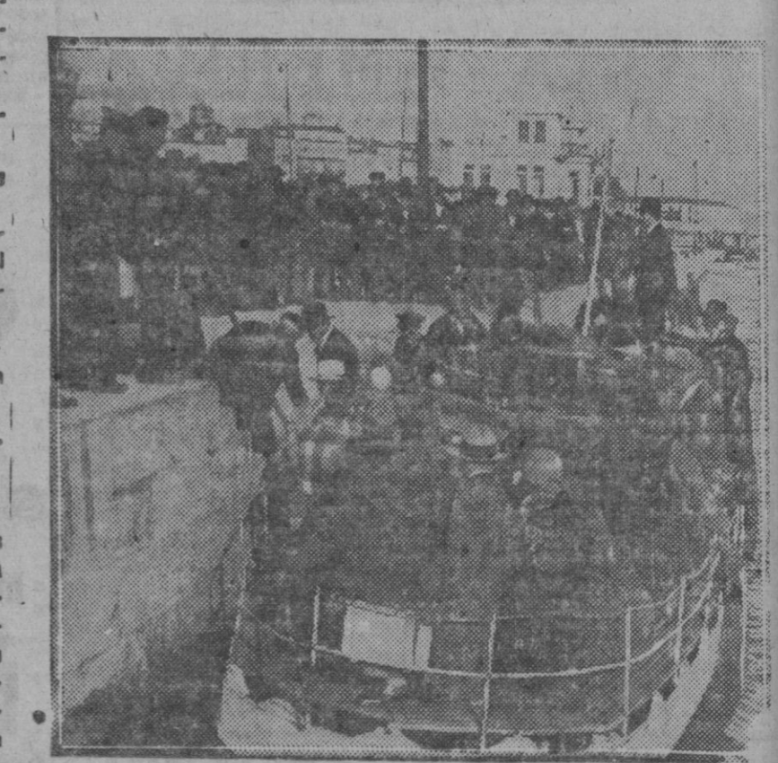
Coruña: Los primeros turistas americanos que han desembarcado para visitar España con motivo de las Exposiciones