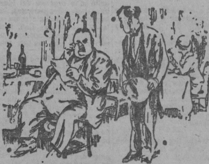
El comensal (mirando la factura).—Pensaba desheredar a mi hijo, pero después de esta cuenta es innecesario.