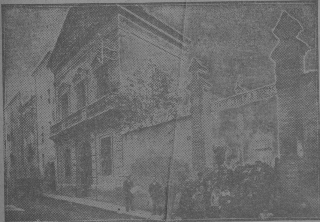
Barcelona: Centro Católico Obrero de Igualada, Sociedad poseedora del número de la Lotería premiado con el segundo (diez millones) y algunos favorecidos por la suerte