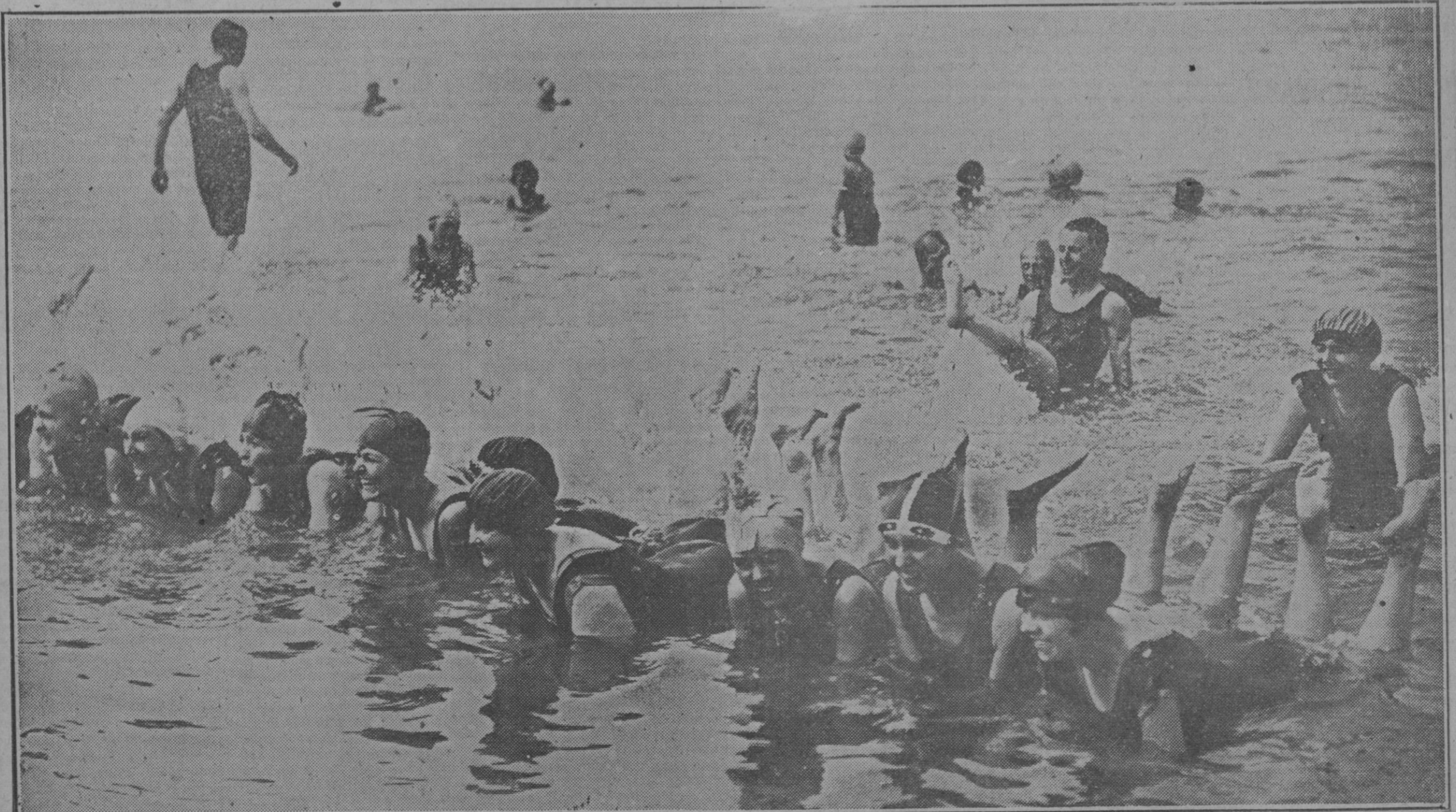
Las bañistas, en la playa inglesa de Folkestone, forman una bella línea de vanguardia contra el avance de las impetuosas olas marinas y nos muestran su valor y... sus encantos