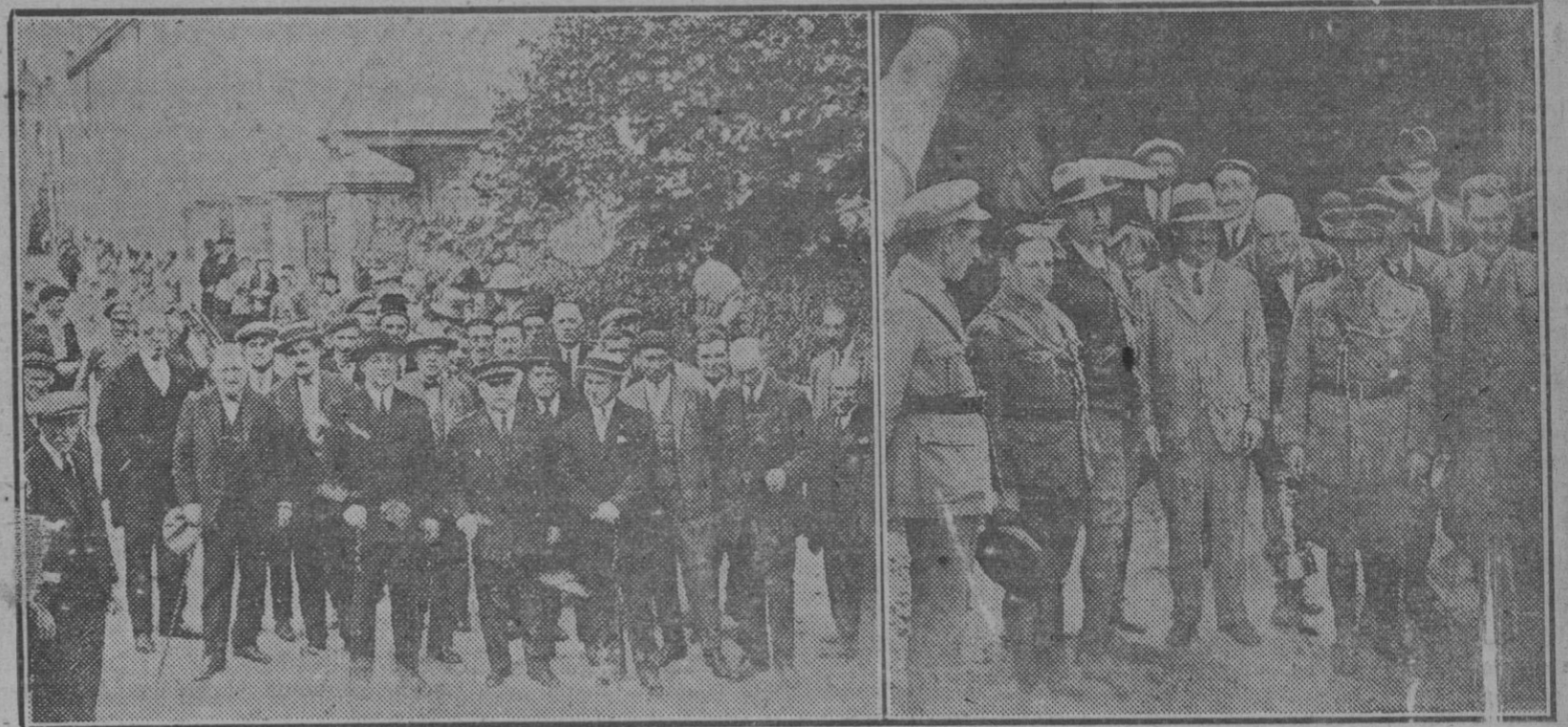
1. El gobernador civil, general Las Peñas, con todos los alcaldes del Valle de Arán, aguardando la llegada del capitán general de Cataluña. — 2. El general Barrera, con el barón de Viver, el conde de Montseny y otras autoridades, al salir de visitar las obras de perforación del túnel Alfonso XIII