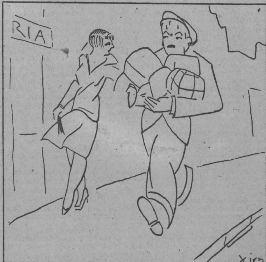
Ella.—Debléramos haber alquilado un burro para llevar los paquetes! EL.—Y pa que lo quieros. ¿No me tiés a mí... que voy cargado gratis?