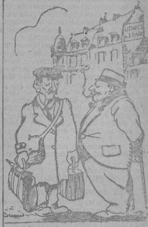
— ¿Dónde va V. con esta cara de lástimas? — Amigo mio, eso va mal, y me voy Carlsbad — ¡Que ocurrencia de irse tan lejos! Haga como yo. Tómese Lishinés del Dr. Gustin. Ptas. 1,50 la caja de 12 paquetes

Moto Harley Davidson Casi nueva, alumbrado eléctrico, arranque magneto, y sieder dos asientos, se vende. Razón: En esta Administración, Dniús, 2.