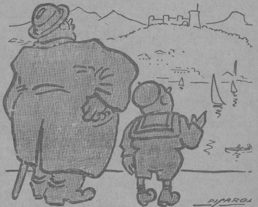
—Y qué, papá: ¿te parece que veremos desde aquí el «raid»? —Indudablemente, hijo.