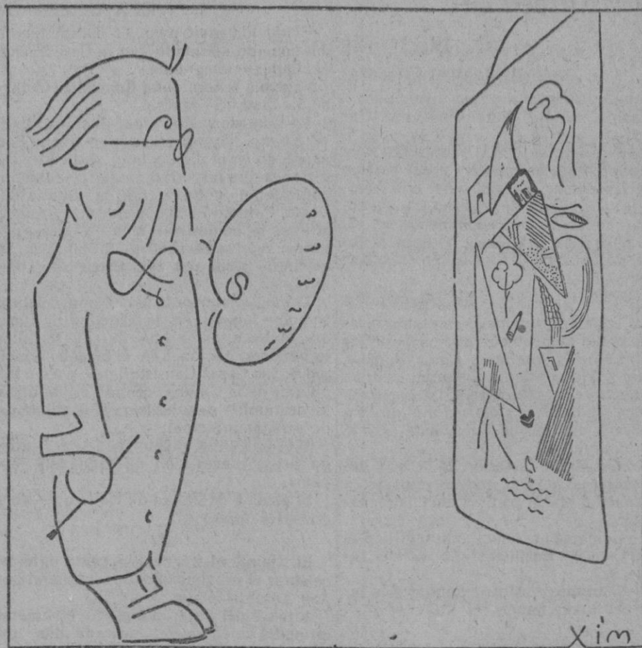
Bendito seas, oh cubismo, que me permites vender como Puerto de Palma lo que en otro tiempo fué el retrato de mi suegra!...