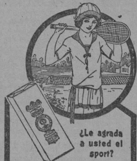
«Le agrada a usted el sport?»