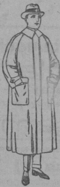
Impermeables raglán en azul y colores. de ptas. 32 a 170