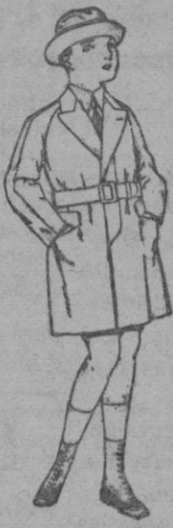
Gabanes de patén, gamuza, etc. para niños y jovencitos de 10 a 16 años. de ptas. 30 a 75

Ropas confeccionadas para Caballero, Señora, Niño y Niña