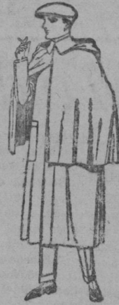
Impermeables mackferland en negro y azul. de ptas. 35 a 175