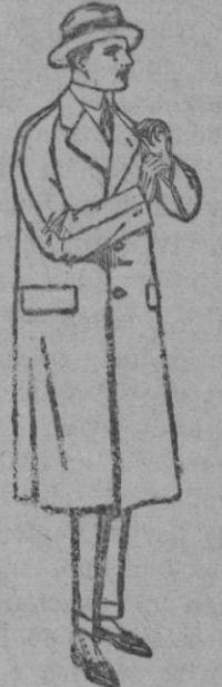
Gabanes raglán de patén, melton o cheviot, con forro seda o satén. de ptas. 60 a 160