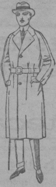
Gabanes raglán de patén, gamuza o cower. de ptas. 75 a 200

SUCURSALES: Madrid, Barcelona, Alicante, Almería, Bilbao, Cádiz, Cartagena, Gijón, Granada, Málaga, Santander, Sevilla, Valencia, Valladolid, Zaragoza