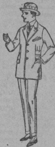
Trajes de patén, vicuña o jerga, forma Sport para niños y jovencitos de 10 a 16 años. de ptas. 40 a 35