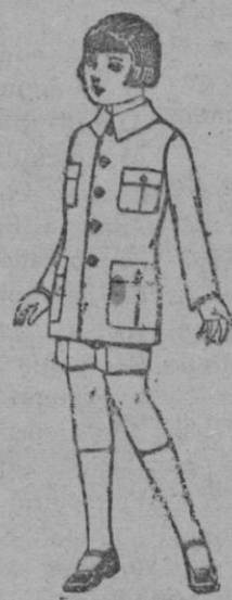
Trajes de patén modelo Sport para niños de 7 a 9 años. de ptas. 22 a 35