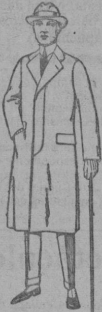
Gabanes de cheviot, gamuza o patén etc. de ptas. 45 a 140