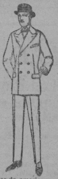
Trajes de americana cruzada y de una hilera de melton, cheviot, estambre, vicuña o jerga. de ptas. 32 a 135