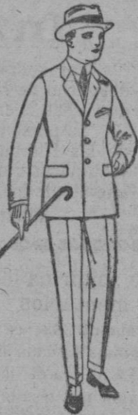
Trajes de patén, vicuña o jerga, para niños y jovencitos de 10 a 16 años. de ptas. 30 a 35