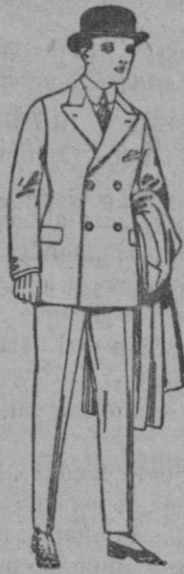
Trajes de patén, vicuña etc. para niños y jovencitos de 10 a 16 años. de ptas. 32 a 35