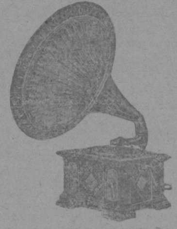
Compre V. un acreditado "PARLOFON-CASTELLÁ" a pagar en 20 meses que es la mayor garantía