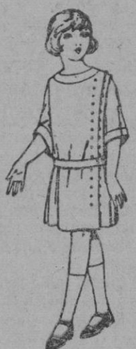
Vestidos de crepé de lana, estambre, etc., en azul y color para niñas de 4 a 9 años, de ptas. 30 a 40