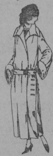
Abrigos de gamuza, gabardina, etc., en negro, azul y color de ptas. 70 a 100