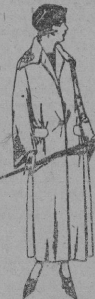
Abrigos de gamuza, ratina, etc., en negro, azul y color, adornos bordados, de ptas. 35 a 110