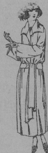
Abrigos de cheviot, gabardina, ratina, etc., en negro, azul y color, de ptas. 50 a 75