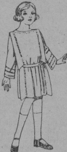
Vestidos de sarga inglesa, popeline, etc., en azul y color, adorno pespunte de seda, para niñas de 4 a 9 años, de ptas. 35 a 42