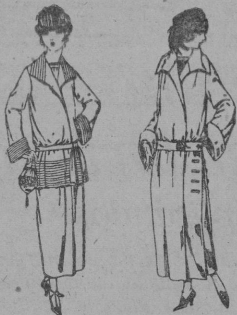
Trajes sastre de sarga inglesa, cheviot, etc., adorno pliegues, chaqueta forrada de seda, en negro, azul y color de ptas. 130 a 165

SUCURSALES: Madrid, Barcelona, Alicante, Almería, Bilbao, Cádiz, Cartagena, Gijón, Granada, Málaga, Santander, Sevilla, Valencia, Valladolid, Zaragoza