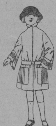
Abrigos de terciopelo de lana, gabardina, etc en azul y color, para niñas de 4 a 12 años, de ptas. 30 a 50