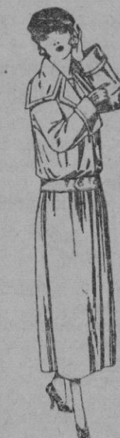
Guardapolvos de dril crudo, gris, etc. de ptas. 25 a 40