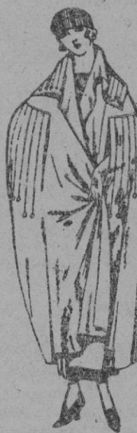
Capas de gabardina, pañetes, etc., diferentes colores, de ptas. 35 a 125