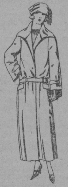
Abrigos gabardina inglesa impermeabilizada, en negro, azul y color de ptas. 70 a 165