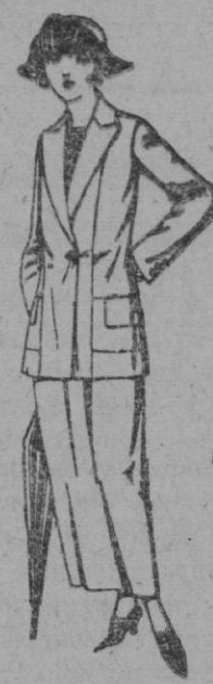
Trajes sastre, de sarga inglesa, satén, estambre, etc chaqueta forrada de seda, en negro, marino y colores moda, de ptas. 115 a 150