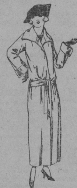
Guardapolvos de dril, satén, etc., colores moda, de ptas. 29 a 50