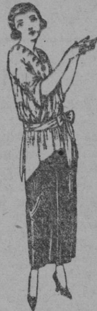
Paletots de punto de seda, en negro, azul y color, de ptas. 50 a 130